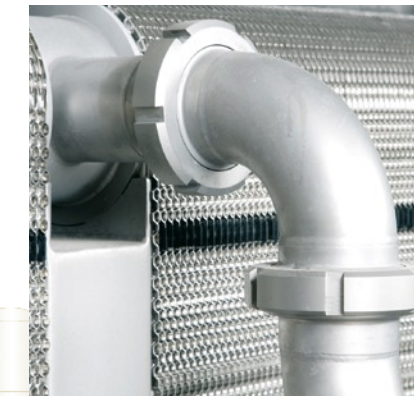
oben: Kälteanlage unten: Plattenwärmeübertrager in einem Kurzzeiterhitzer