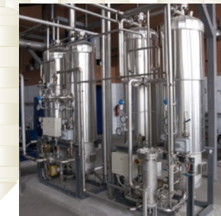
oben: Wasserentgasung DIOX™ unten: CO 2 -Rückgewinnung