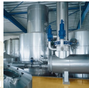
oben: Würzekochen unten: Energierückgewinnung