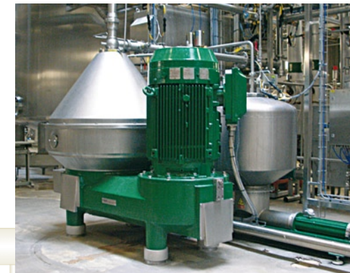
oben: Bier-Entalkoholisierung unten: Separator