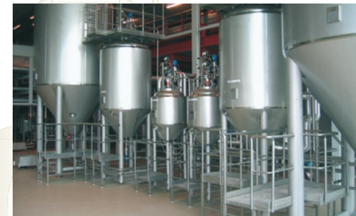
oben: ECO-MATRIX™ unten: Hefemanagement YEAST-STAR™